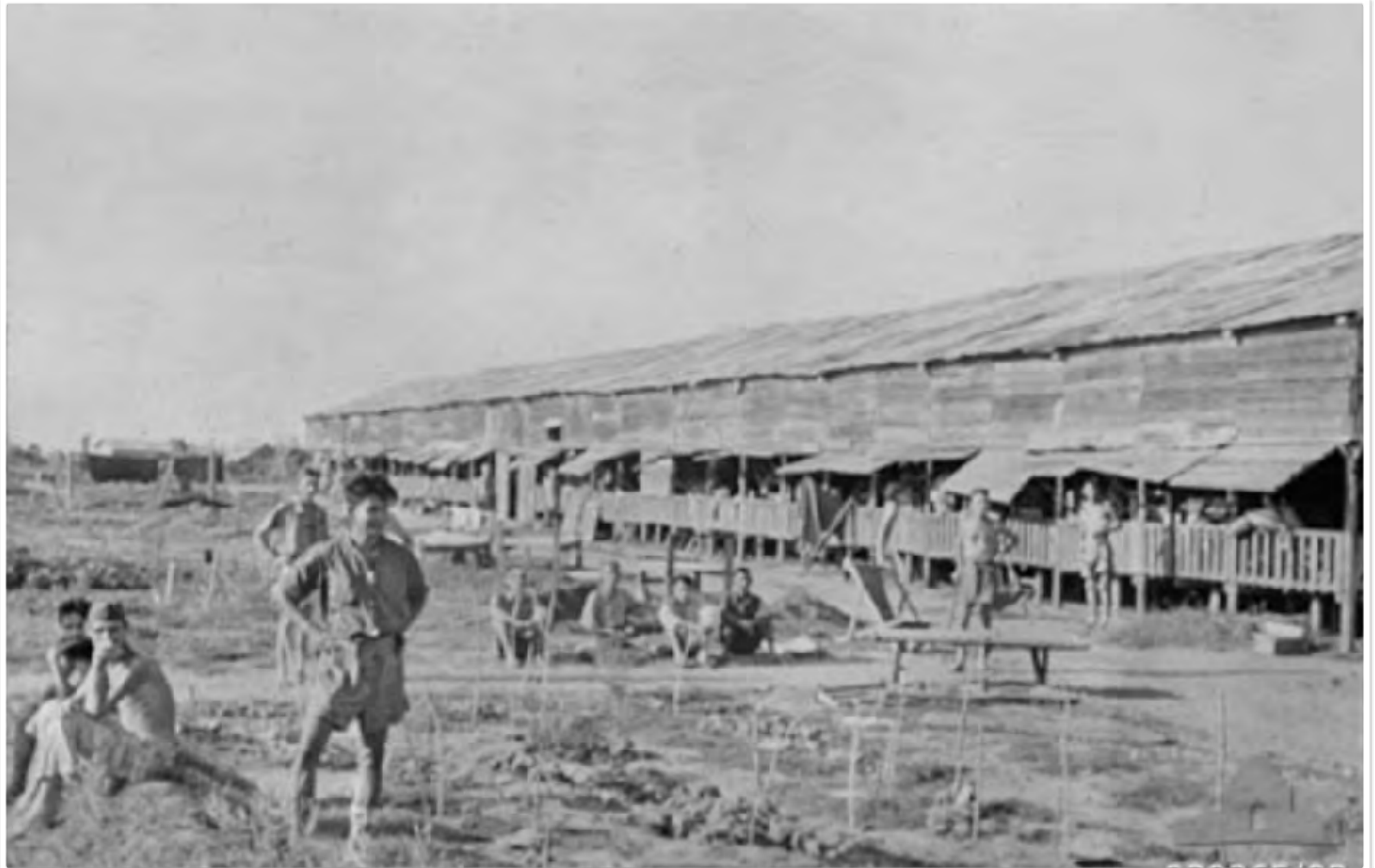
Bakli Bay, Hainan Island. c. 28 August 1945. General view of the prisoner of war (POW) Camp Hospital