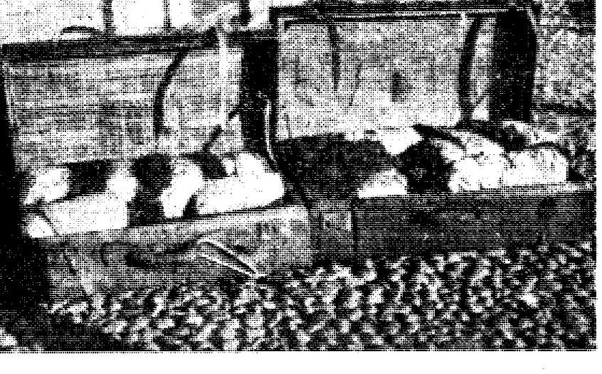
De grote hoeveelheden opium, die indertijd door de politie te Soerabaja werden ontdekt en in beslag genomen en waardoor de grote republikeinse smokkelhandel in het helisap aan het licht werd gebracht

BLIJKEAAR gewezen op zijn in alle opzichten fout gebaar om tot de Republiek van Soekarno het verzoek te richten een zekere hoeveelheid suiker en rijst ter beschikking van de van huis en haard verdrevenen in Palestina te stellen, heeft graaf Bernadotte dit verzoek, zoals uit een bericht, elders in dit blad geplaatst, blijkt, zich daarop met hetzelfde verzoek gewend tot de Nederlands-Indi-